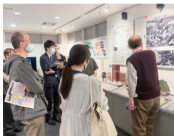
展示を見つめる参加者

事務委員会のフィールドワーク企画で、前年に続いてピースあいちを訪れました。改憲の発議が現実味を帯びてきた今、戦争の悲惨さを学び、平和の尊さ、憲法の重要性を実感するためにこのフィールドワークを企画し、参加者は10名でした。構成は戦争体験の語り、ガイドによる館内展示の解説、事務委員会に