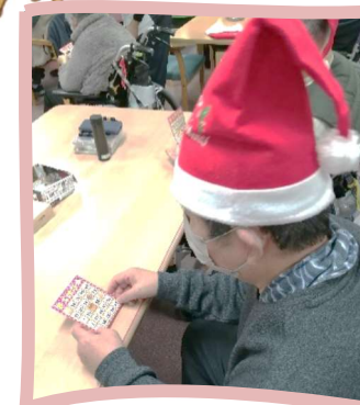
何番が呼ばれたか 自分のカードをしっかりと確認