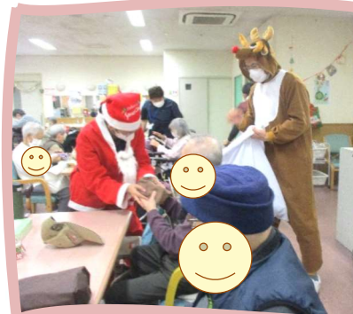
タイケアから皆様へクリスマスプレゼントです！ 中身は帰ってからの楽しみ☆