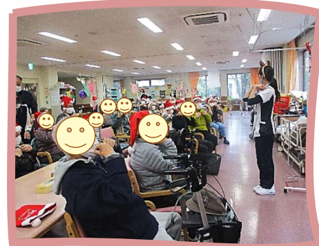
肩甲骨も腕もしっかり伸ばしましょう！