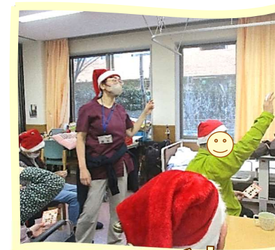
ビンゴ！ そろった方は手を上げて！！