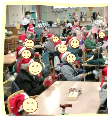
ご利用者様、職員全員でクリスマスソングを合唱♪