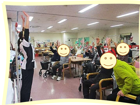
お楽しみの前に、体を動かすことを忘れずに！ しっかりと腕を上げてー！