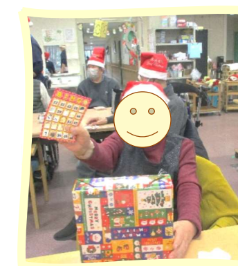
商品GET！おめでとうございます！