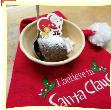
おやつはケーキでした