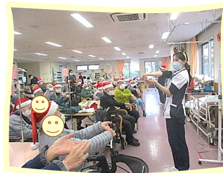
手のひらもしっかり 伸ばします！