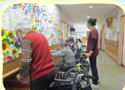
立ち上がり訓練中