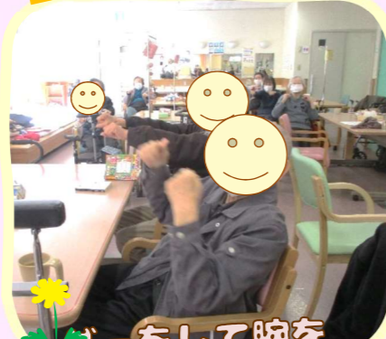
ロープをして腕を 伸ばしています