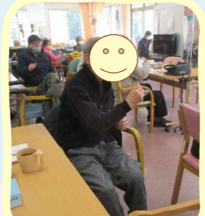
腰をひねってリハビリ体操