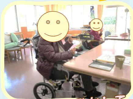
腕をしっかり動かして