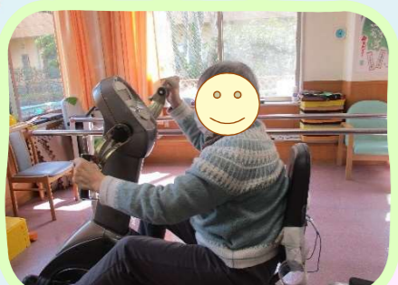
バイクに乗って運動!