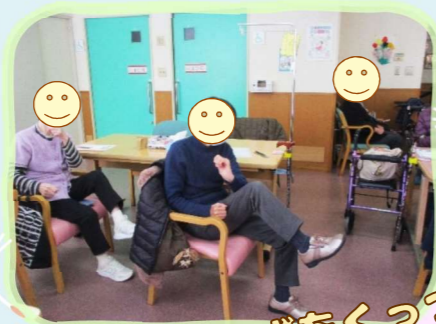
ひじとひざをくっつけて