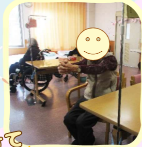
手を組んで前に伸ばす！