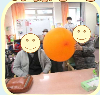
ふうせんを持って ポーズ