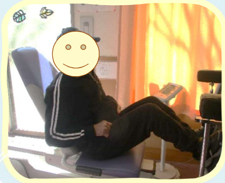
レッグプレス重い。。。 イラスト: 二人の女性が会話している様子