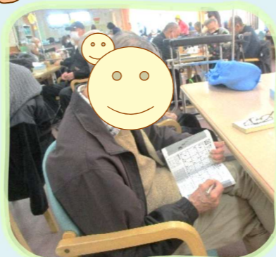
ナンプレは難しい。。。