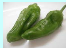
かわいいピーマンが収穫できました

この夏はかなりの猛暑に加え、大きな台風も参りましたが、力を合わせて畑の手入れを続けています。