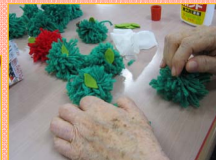
毛糸を紙に巻くことで手首の運動になりました。ハサミで形を整え、秘栗を再現！！葉っぱを貼った物はリンゴになりました！！