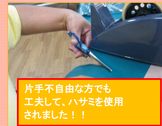
片手不自由な方でも工夫して、ハサミを使用されました！！