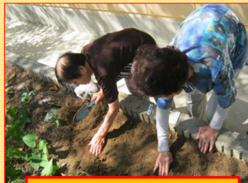
ブロッコリーの苗植え