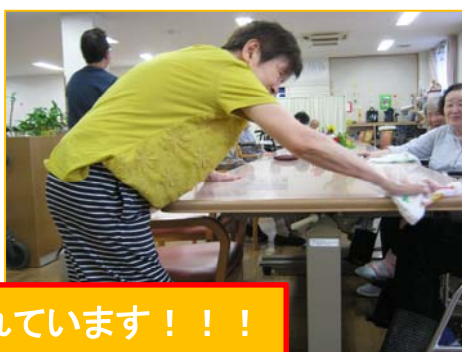
丁寧に取り組まれています！！

「やらないよりは、やったほうが、腕をのばしている感じが分かる！」との感想も聞かれました。 個別のプログラムに関して、ご要望がありましたら、いつでもスタッフにご相談ください。